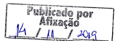
MAURO RUI HEISLER Prefeito Municipal